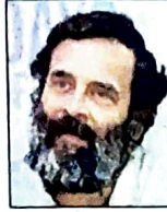
রাহুল গান্ধী , কংগ্রেস সাংসদ রায়পুরে কংগ্রেসের প্রেনারি অধিবেশনে

সম্প্রতি এক মন্ত্রী (এস জয়শঙ্কর) বলেছেন চিন যেহেতু বড় অর্থনীতির দেশ, ভারত তাদের সঙ্গে লড়তে পারবে না। আমাদের দেশে ব্রিটিশ শাসন চলাকালীন তাদের অর্থনীতি আমাদের থেকে বড় ছিল না? সরকার কি এটাই বলতে চায়, ভারত কেবল তার থেকে দুর্বলদের সঙ্গে লড়বে, শক্তিশালীদের বিরুদ্ধে নয়? এটা কাপুরুষতা। এটা সত্যরকরের আদর্শ। শক্তিশালীর সামনে মাথা নত করে রাখা।