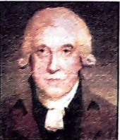
— জেমস ওয়াট।