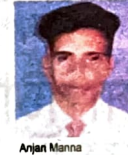
Anjan Minna Crystal By Morpho Goa