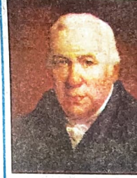
— স্কটিশ পদার্থবিদ ড্যানিয়েল রাদারফোর্ড (১৭৭২ সালে)।