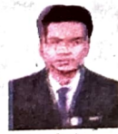
Subham Singha JP Group of Hospital