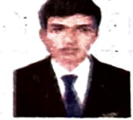
Ritam Laha Coutyard By Marriot, Bangalore