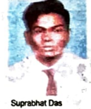
Suprabhat Das Crystal By Morpho Goa