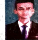
Debashis Roy Coutyard By Marriot, Bangalore