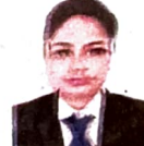
Indrani Malty Coutyard By Marriot, Bangalore