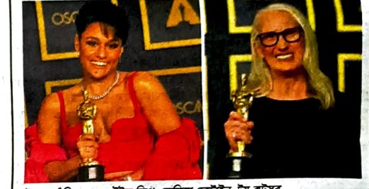
উপরে বাঁদিক থেকে: উইল স্মিথ, জেসিকা চেস্টাইন, ট্রয় কটসুর নীচে বাঁদিক থেকে: আরিয়ানা ডি-বোস ও জেন ক্যাম্পিয়ান

২৮ মার্চ: লস অ্যাঞ্জেলেস-এর ডলবি থিয়েটারে ৯৪তম অস্কার পুরস্কার প্রদান করা হল। এই বছর সেরা ছবির পুরস্কার জিতল সিয়ান হেজার পরিচালিত 'জোভা'। সেরা অভিনেতা উইল স্মিথ (ছবি: কিং রিচার্ড), সেরা অভিনেত্রী জেসিকা চেস্টাইন (ছবি: দ্য আইজ অব ট্যামি ফেই)। সেরা সহ-অভিনেতা হয়েছেন ট্রয় কটসুর (ছবি: কোভা), সেরা সহ-অভিনেত্রী আরিয়ানা ডি-বোস (ছবি: ওয়েস্ট সাইড স্টোর)। 'দ্য পাওয়ার অব দ্য ডগ' ছবির জন্য সেরা পরিচালক হয়েছেন জেন ক্যাম্পিয়ান।