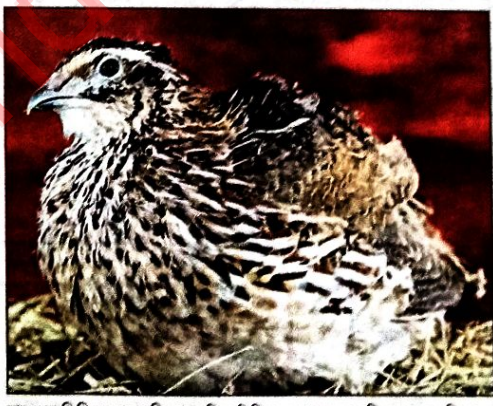
যার নাম তিতিল, তার প্রতিপালন কিন্তু নিবিড়। শুধুমাত্র জাপানি কোয়েল প্রতিপালন করা যায়।

জাপানি কোয়েল পাখির মাংস ও ডিম স্বাদে এবং পুষ্টিগুণে হাঁস-মুরগির তুলনায় উচ্চ মানের। সেজন্য বাজারেও এর চাহিদা ক্রমশ বাড়ছে। পশ্চিমবঙ্গ সরকারের উদ্যোগে আয়োজিত জাপানি কোয়েল চাষের প্রশিক্ষণ নিয়ে অনেকেই এ পাখির চাষ করছেন। উৎপাদিত ডিম-মাংস কিনে নেয় সরকারের হরিণঘাটা মিট প্র্যান্ট। প্রশিক্ষণ নিয়ে যে-কেউ এই ব্যবসা করে স্বনির্ভর হতে পারেন।