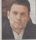
রাহুল গাফী, কংগ্রেস সাংসদ