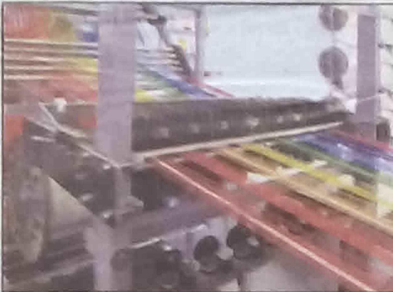
খুচরো বিপণনের গুরুত্বপূর্ণ উপাদান। অ্যাপারেল শিল্পে পোশাক উৎপাদন নিয়ে কাজ হয়, সেখানে হোম ফ্যামিলিয়ে ঘরোয়া সামগ্রী — ব্যাগ, ব্যাগেট, কাপেট, তোয়ালে, জানলার শেডস, বিছনার চাদর, টেবিল ক্রথের নকশা ও উন্নতি নিয়ে কাজ হয়।

আ মাদের মৈনদ্দিন জীবনের গুরুত্বপূর্ণ অংশ হল, বস্ত্র। সেই প্রাচীনকাল থেকে বস্ত্রশিল্প ভারতের কর্মসংস্থান ও রাজস্ব আদায়ের গুরুত্বপূর্ণ ক্ষেত্র। কৃষির পর বস্ত্রশিল্পই এ দেশের দ্বিতীয় বৃহত্তম কাজের ক্ষেত্র। এই শিল্পে প্রত্যক্ষভাবে ৪৫ মিলিয়ন মানুষের কর্মসংস্থান হয় আর পরোক্ষভাবে ৬০ মিলিয়ন মানুষ বস্ত্র অনুসারি শিল্পের সঙ্গে যুক্ত। কেন্দ্রীয় বস্ত্র মন্ত্রকের এক রিপোর্ট অনুসারে, জাতীয় শিল্প উৎপাদনে এই শিল্পের ১৪% অবদান আছে। আর এই শিল্পজাত পণ্য বিদেশে রপ্তানি থেকে ১২% মুদ্রা আয় হয়। বিশ্ব বাজারে ভারতের বস্ত্রশিল্পের বিভিন্ন ধরণের সামগ্রী আছে শীর্ষ তালিকায়। যেমন, পাট ও পটিজাত সামগ্রী তৈরির সবচেয়ে বড় ক্ষেত্র, তুলো উৎপাদনে দ্বিতীয় বৃহত্তম ক্ষেত্র, সিঙ্কেটিক উৎপাদনে চতুর্থ বৃহত্তম ক্ষেত্র আর উল উৎপাদনে ষষ্ঠ বৃহত্তম ক্ষেত্র। এই তথ্য থেকে সহজেই বোঝা যায়, এই মুহূর্তে ভারত বস্ত্র ও তৈরি পোশাক উৎপাদনের সবচেয়ে বড় দেশ। সারা বিশ্বের বস্ত্র ও পোশাক শিল্পের বাজারে ৬৩% ভারতের দখলে। সমীক্ষা অনুযায়ী, আগামী ২ বছরে বস্ত্রশিল্পে ১ কোটি ২০ লাখ মানুষের কর্মসংস্থানের সুযোগ তৈরি হবে।